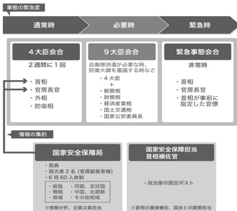
図2：日本国家安全保障会議の組織