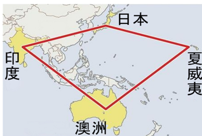
圖 3 日相安倍所提亞洲「民主安保之鑽」構圖

以外，日本唯一與第三國發表「安保共同宣言」(2007 年)、定例召開國防與外交部長聯席會議(2+2)的準同盟國。安倍於去年 12 月 27 日在英文網頁發表文章，提出建構包括澳洲在內，由日本、美國夏威夷、印度等四地海洋力量所構成的亞洲「民主安保之鑽」(Democratic Security Diamond，如圖 3)，以維護從印度洋到西太平洋的海洋安全，共同因應中共在東海及南海之強勢作為。 29 安倍預定在雅加達發表演說中所揭櫫的日本對東南亞外交五項新原則，即包含平衡中共對海洋安全所造成威脅之戰略構想。 30 此次外相岸田訪問澳洲，與澳洲外長卡爾(Bob Carr)舉行會談時，亦針對中共強勢進出海洋問題交換意見，並達成兩國繼續深化外交安保合作的共識。