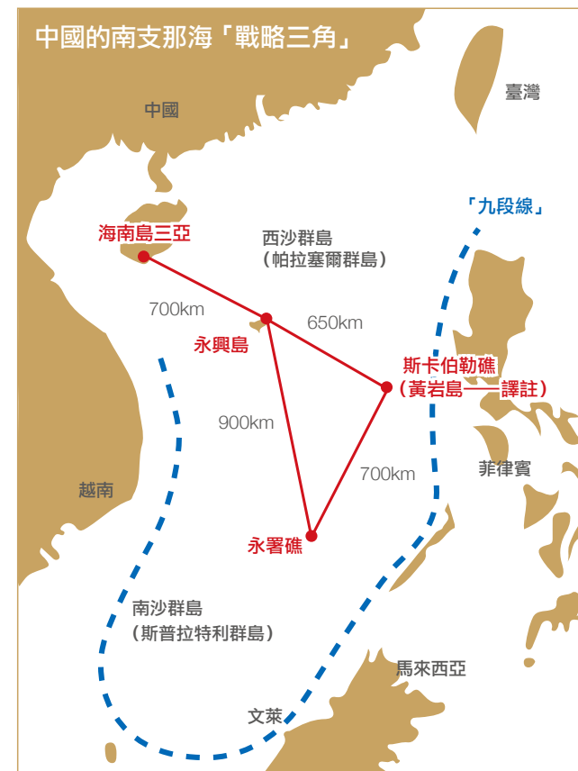
圖 2. 中共南海「倒三角形」戰略部署 資料來源：香田洋二，中國在南支那海環礁的填海造島與日本的安全保障，走進日本，同註 50。

三角形海空軍事基地網絡 (如附圖 2)，控制南海南端入口，屆時南海將實質上變成日本首相安倍晉三所言的「北京之湖」。由於黃岩島距離菲律賓蘇比克灣 (Subic Bay) 海軍基地僅 150 英里，一旦進行吹沙造陸並予以軍事化，將成為監控駐防於蘇比克灣基地的美軍。誠如日本海上自衛隊退役艦隊司令官香田洋二指出，中共在南沙群島的軍事化措施，不僅將改變美中兩國在南海的軍事平衡，而且中共部署在亞龍灣的戰略核武潛艇活動範圍將擴大到太平洋和印度洋，導致美中戰略核武均衡發生變化，嚴重衝擊亞太區域安全。 50