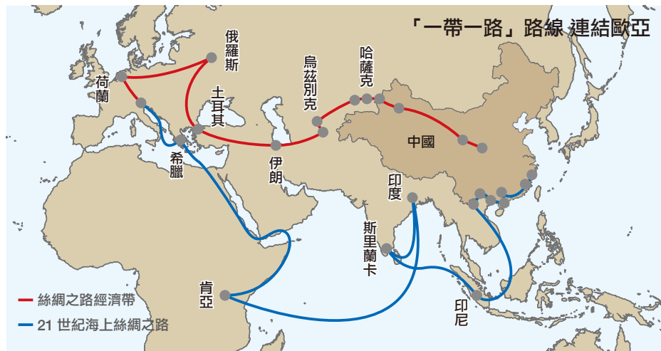
圖 3. 「一帶一路」構想路線示意圖

中共在南沙群島展開吹沙造陸的同時，也由國家主席習近平於 2013 年 10 月 3 日在印尼國會發表演講，拋出「21 世紀海上絲綢之路」(21st Century Maritime Silk Road) 構想，與其在哈薩克所提出的「絲綢之路經濟帶」(Silk Road Economic Belt) 合稱為「一帶一路」構想(如圖 3)。習近平強調，自古以來，東南亞就是「海上絲綢之路」的重要樞紐，中方願意利用「中共—東協海上合作基金」或者是「亞洲基礎設施投資銀行」(AIIB)，致力於建設中共與東協國家間的互聯互通網絡，發展良好的海洋合作夥伴關係，並且以和平對話方式，妥善處理中共與東協部分國家間的南海爭議問題。 51 翌月 12 日，中共 18 大 3 中全會通過《中共中央關於全面深化改革若干重大問題的決定》，要求「加快同周邊國家和區域基礎設施互聯互通建設，推進絲綢之路經濟帶、21 世紀海上絲綢之路建設，形成全方位開放新格局」。 52 12 月 10-13 日召開的中共中央經