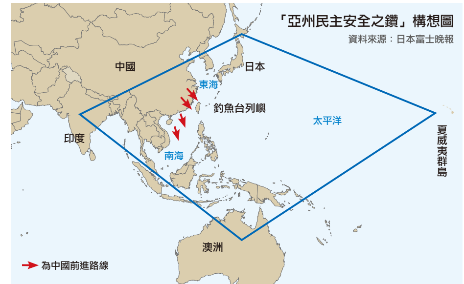
圖3. 「亞洲民主安全之鑽」構想示意圖